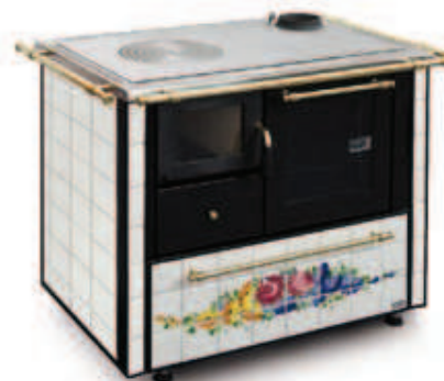
Esempio finitura con piastrelle, inserite in cornicetta nera, accessoriata con corrimani su tre lati e fianchi piastrellati.