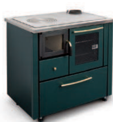
Esempio finitura standard: verde