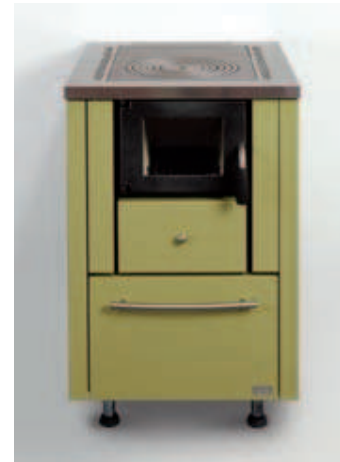
Esempio finitura: colore a scelta del cliente (verde pastello), con rivestimento senza cornicetta.

Il modello CE45 può essere realizzato con due ampliamenti laterali sia per un maggior isolamento dei fianchi, sia per ottenere la larghezza di 55 cm.