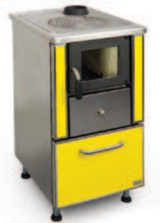
Esempio finitura: colore a scelta del cliente (giallo), con rivestimento inserito in cornicetta inox.