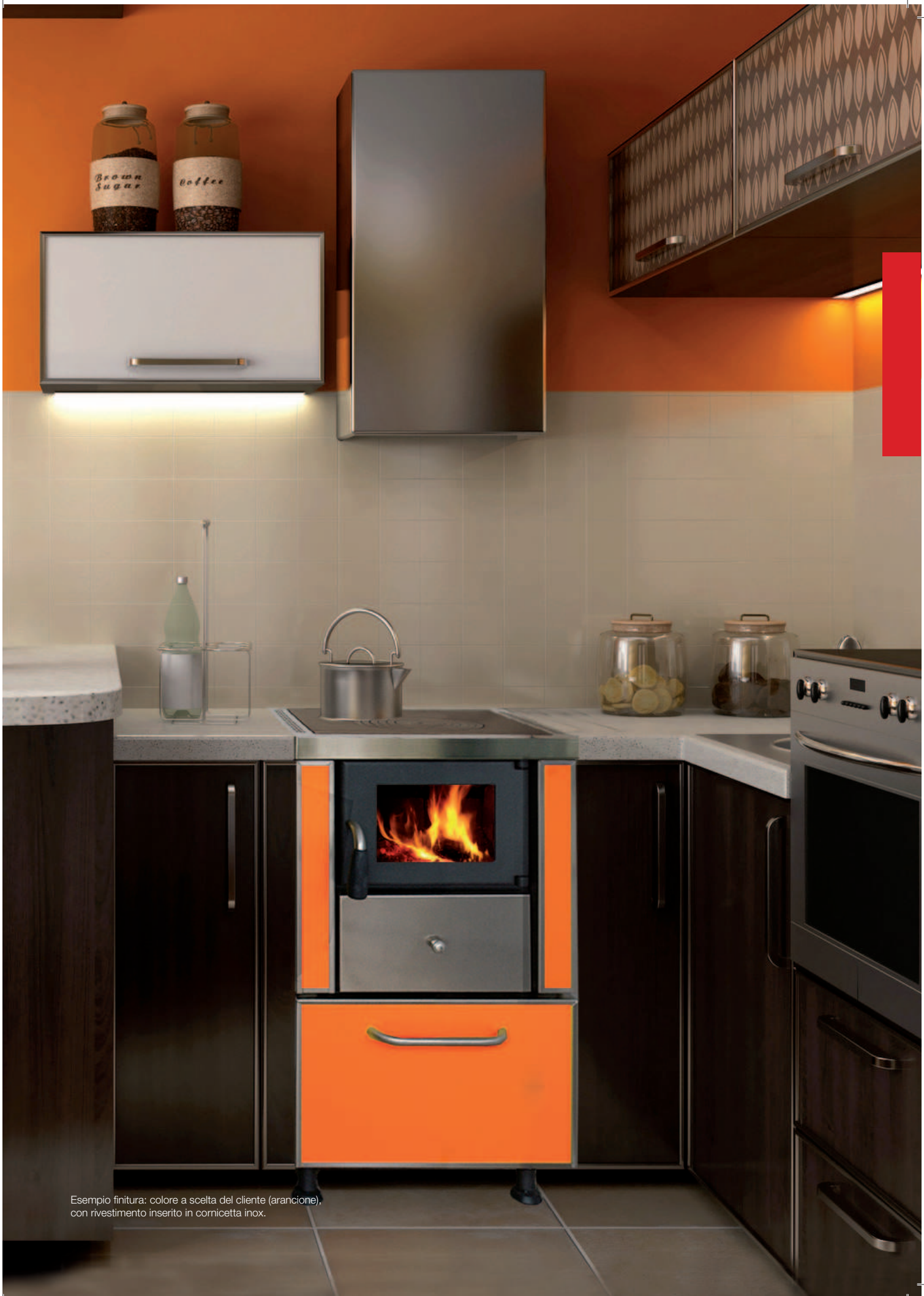
Esempio finitura: colore a scelta del cliente (arancione), con rivestimento inserito in cornicetta inox.